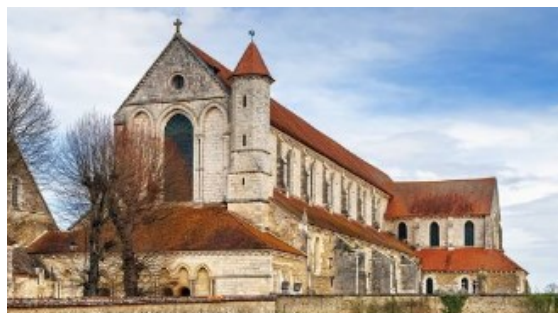
Abbaye de Pontigny