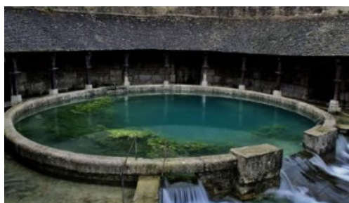
La Ferme de la Fosse Dionne